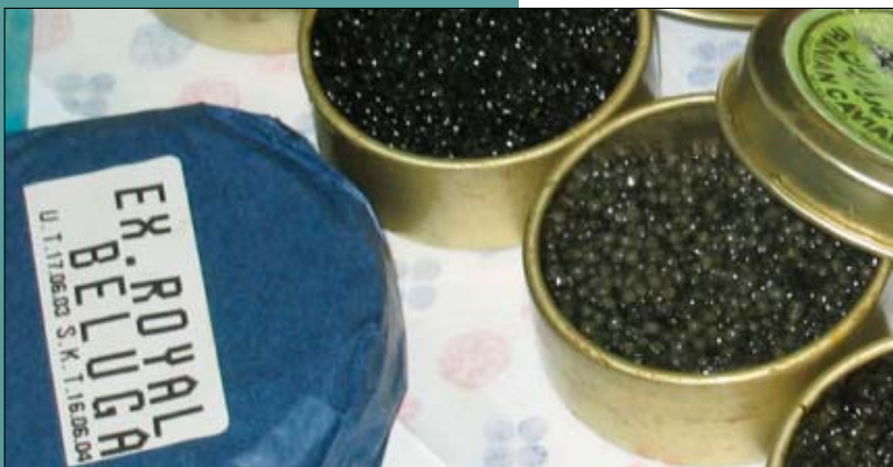
Le caviar beluga peut être vendu jusqu'à 600 EUR les 100 gr au détail

En mai 2006, l'Union européenne (UE) a adopté le Règlement de la Commission européenne (CE) no 865/2006 , qui a été ensuite modifié par le Règlement (CE) no 100/2008 , qui rend obligatoire l'étiquetage de tous les conteneurs de caviar dans tous les États membres de l'UE. Depuis lors, tous les emballages de caviar sur le marché de l'UE doivent comporter une étiquette CITES, quelle que soit leur taille. Il est donc essentiel que toutes les parties prenantes au commerce et à la distribution du caviar (y compris les