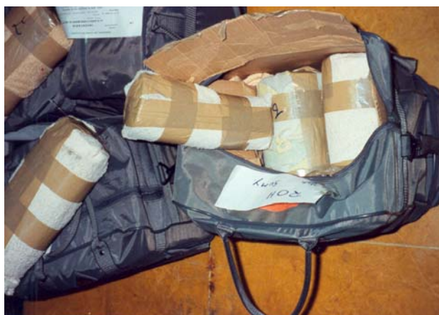
149 kilos d'ivoire semi-travaillé en provenance du Gabon et à destination de la Corée du Sud, saisis le 5 juin 1991 à l'aéroport de Bruxelles-National

Il semblerait qu'un nombre important de saisies belges d'envois en transit concerne de l'ivoire brut ou semi-travaillé africain envoyé vers les manufactures d'ivoire asiatiques via la Belgique. Cet ivoire illégal transiterait par la Belgique en raison de voies aériennes privilégiées reliant ce pays aux pays africains producteurs d'ivoire d'une part et aux marchés asiatiques d'autre part. Les pays asiatiques constitueraient alors soit des pays où l'ivoire est travaillé, soit des pays de destination finale. L'ivoire saisi en transit en Belgique en provenance du Gabon était, par exemple, dans presque tous les cas de saisie, destiné à la Corée du sud et, de même, l'ivoire saisi en Belgique en provenance du Mali était presque toujours destiné à la Chine. Les données ETIS-Out rendent compte également d'une importante saisie d'ivoire, 350 kg, effectuée en Corée du Sud en 1997, concernant un envoi provenant du Gabon ayant transité par la Belgique où il n'a pas par ailleurs été détecté ( Annexe 8 ). Les données ETIS-In attestent d'un même parcours pour de l'ivoire saisi en Belgique provenant du Gabon et destiné à la Corée du Sud en 1989, 1991 et 1997 alors que les données EU-TWIX rendent compte d'un itinéraire similaire pour de l'ivoire saisi en 1989 et 1991, mais pas en 1997.