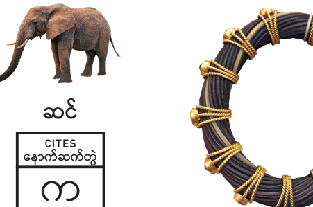
အမြှီး၊ အမွှေး၊ နှင့် အရေပြား/အရေခွံ