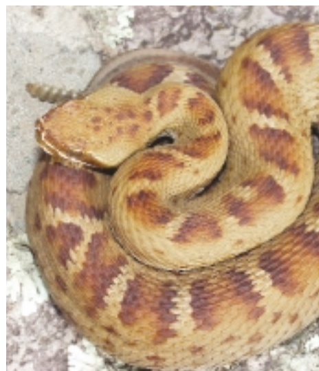
JOSEPH E. FORKES

Las víboras de cascabel están entre las especies más comerciadas en el Desierto Chihuahuense.