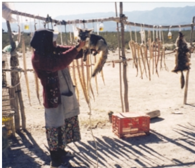
Las especies comercializadas ilegalmente, como la zorra y las serpientes mostradas en la imagen ofrecidas para su venta en San Luis Potosí, México, algunas veces son traficadas internacionalmente en contravención de CITES.