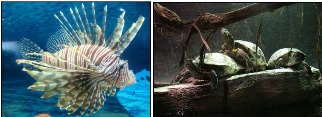
Figuras 7 y 8. El pez león y las tortugas de orejas rojas también conocidas como “japonesas” son especies invasoras que afectan los ecosistemas nativos en México

Asimismo, existen otras amenazas relacionadas e importantes, como por ejemplo los posibles grandes daños económicos a la agricultura, consecuencia de la introducción de especies no nativas y enfermedades por medio del transporte de especies exóticas hacia o a través de un país. Esto puede ocasionar la disrupción significativa de ecosistemas, lo que también puede traer enormes impactos sociales y económicos a los países y las localidades involucradas.