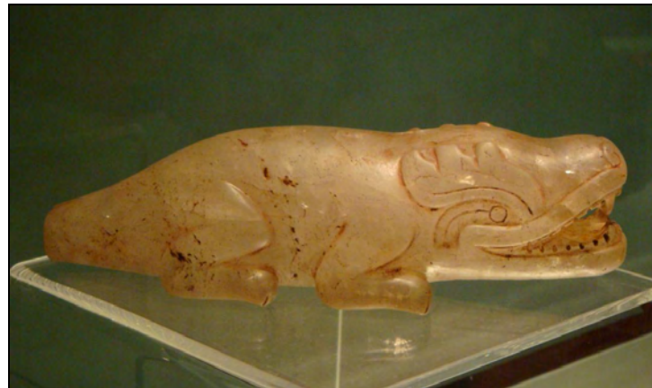
Figuras 2 y 3. Ejemplo de tallas prehispánicas con figura de de animales

Muchas de las especies que forman parte de esta gran riqueza biológica y cultural están seriamente amenazadas por factores como la destrucción del hábitat para explotación forestal, el auge de monocultivos, la apertura de zonas de forrajeo, o el desarrollo del turismo e industria no sustentable. Desde hace más de una década, se estimaba que en México el 80% del territorio mostraba marcas de erosión (Carabias, 1999), y más de la mitad de la vegetación original que cubría el país había sido removida para entonces (SEMARNAP, 1997). Más del 95% de las selvas tropicales y 50% de los bosques templados se habían perdido, así como la biodiversidad original en las áreas secas (INE, 2000).