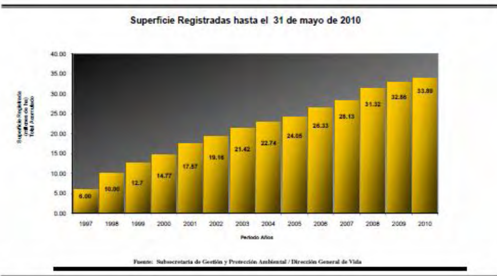
Figuras 9 y 10 Incremento en el número de UMAs y superficie bajo este esquema de 1997-2010