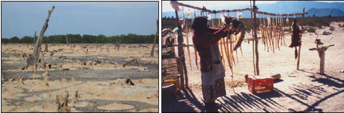
Figuras 4 y 5. La destrucción del hábitat y el comercio ilegal figuran entre las principales amenazas a la vida silvestre

En México ya se han perdido especies como la paloma de Isla Socorro ( Zenaida gravsoni ), el oso pardo ( Ursus arctos horribilis ) o el lobo mexicano ( Canis lupus baileyi ), y muchas otras están actualmente en alguna categoría de riesgo, por lo que una adecuada gestión que asegure su conservación para el beneficio de la presente y futuras generaciones es fundamental.