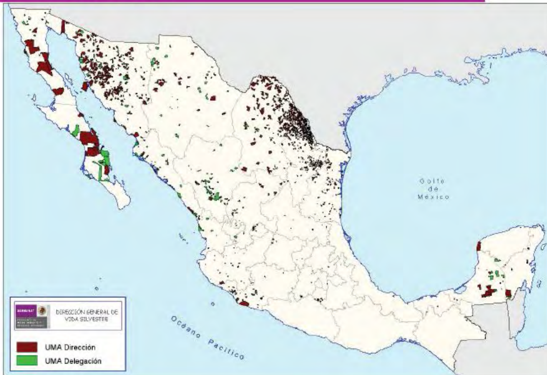
Figura 11 Mapa del SUMA